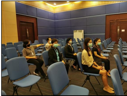
เว้นระยะห่างตามที่จัดไว้ให้