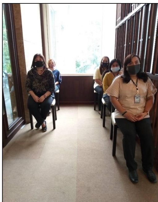
14. นั่งรอเรียกทำประวัติฯ