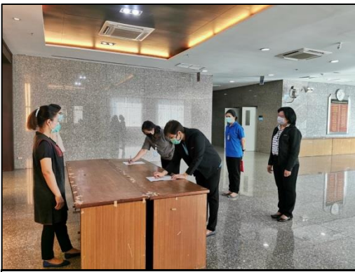
7. ลงทะเบียนด้วยปากกาของตนเอง