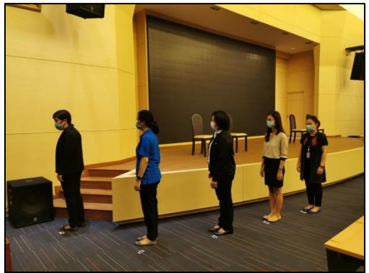
9. เข้าแถวรอเรียกตามจุด mark