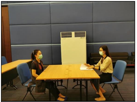
11. กรอกรายละเอียด (วุฒิการศึกษา เลขที่ตำแหน่ง สิ่งกีดที่เลือก)