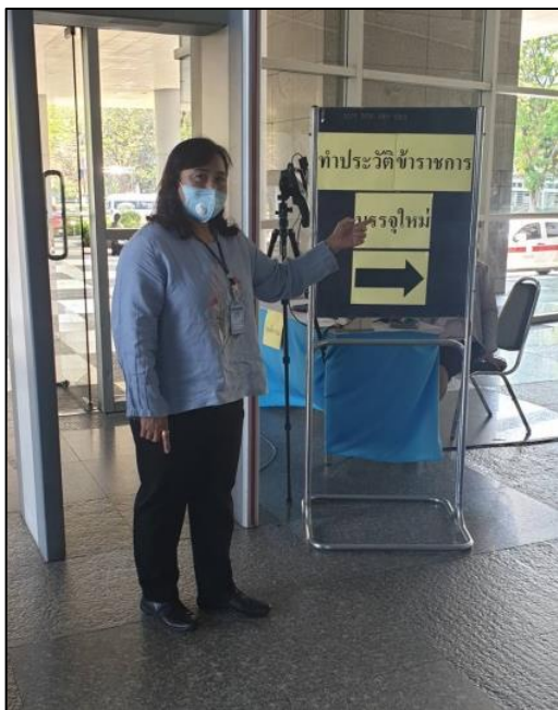
13. จุดทำประวัติข้าราชการบรรจุใหม่