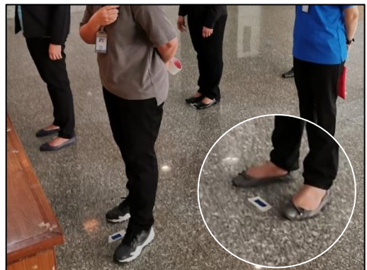
6. เข้าแถวลงทะเบียนตามจุด mark