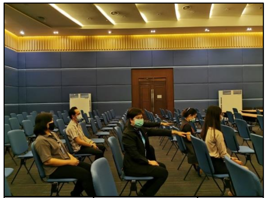
8. นั่งเรียงตามลำดับที่