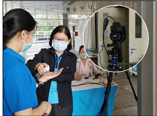
3. ผ่านเครื่องวัดอุณหภูมิ