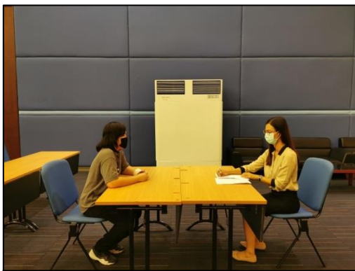
10. เลือกตำแหน่งที่จะเข้ารับการบรรจุ