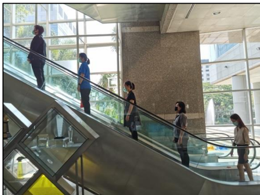
5. ขึ้นบันไดเลื่อนห่างกันอย่างน้อย 2 ชั้น