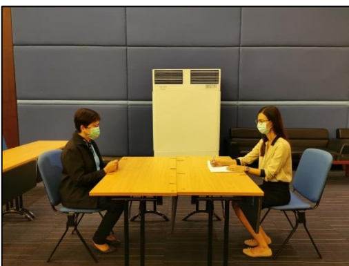
12. รับหนังสือส่งตัว