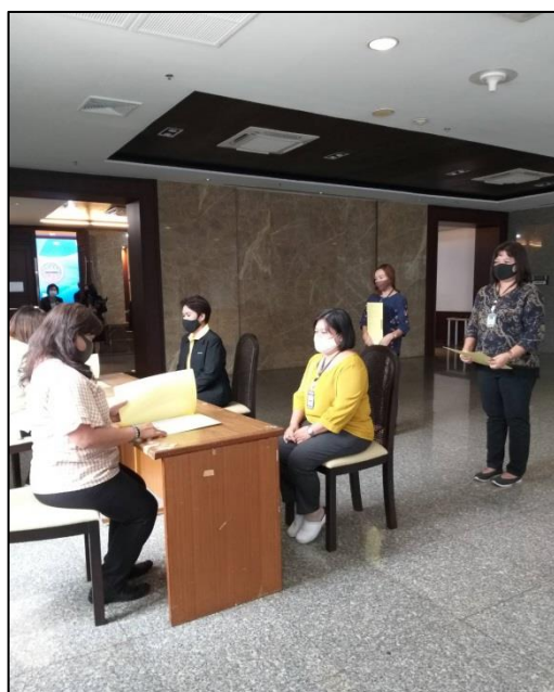
16. ส่งแฟ้มประวัติเพื่อตรวจสอบ ความถูกต้อง