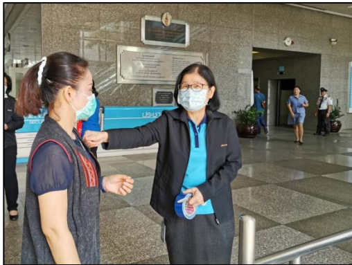
4. ติดสติ๊กเกอร์