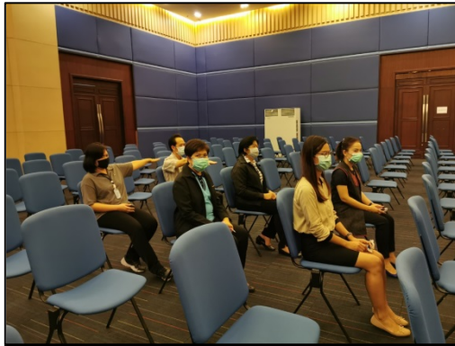
เว้นระยะห่างตามที่จัดไว้ให้