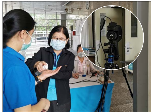
3. ผ่านเครื่องวัดอุณหภูมิ