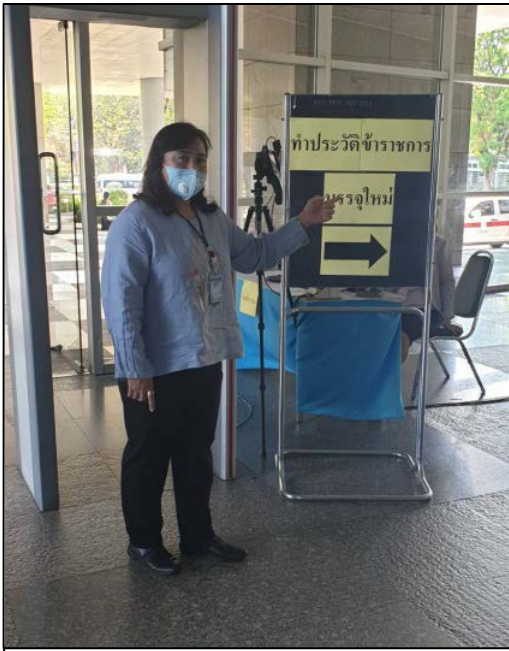
14. จุดทำประวัติข้าราชการบรรจุใหม่