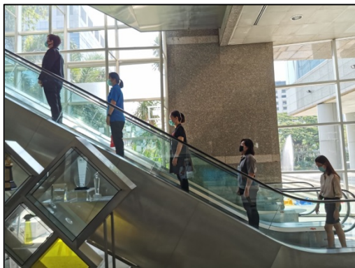
5. ยืนบันไดเลื่อนห่างกันอย่างน้อย 2 ชั้น