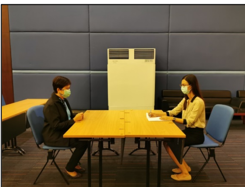
12. รับหนังสือส่งตัว