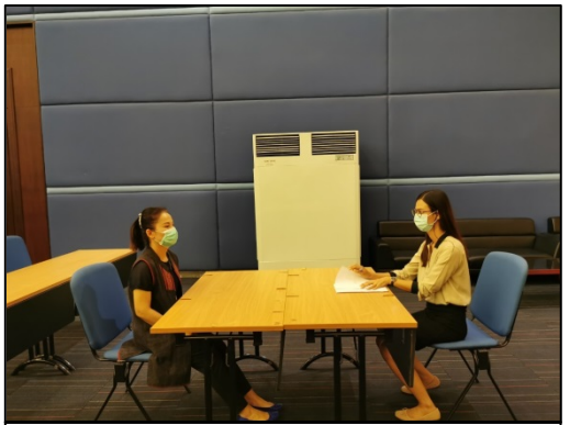
11. กรอกรายละเอียด (วุฒิการศึกษา เลขที่ตำแหน่ง สังกัดที่เลือก)