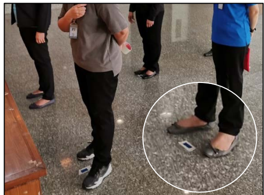
6. เข้าแถวลงทะเบียนตามจุด mark