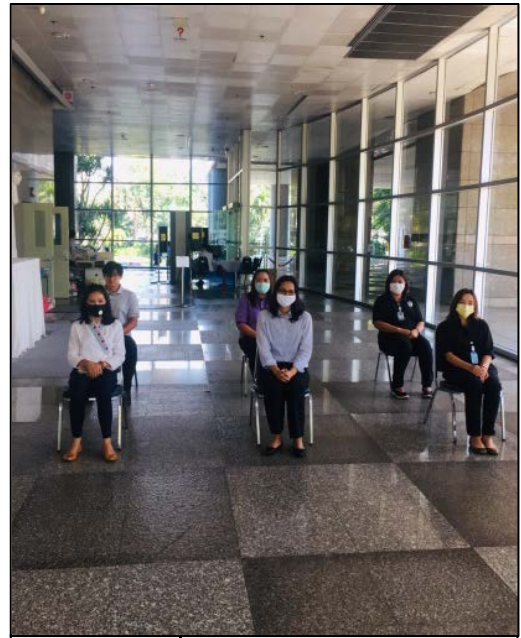
15. นั่งรอเรียกทำประวัติฯ