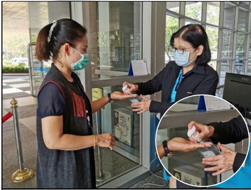
2. ล้างมือด้วยแอลกอฮอล์