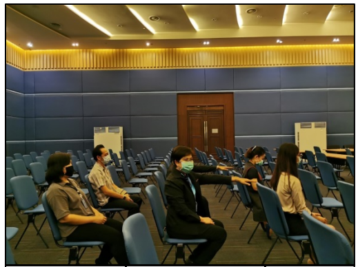
8. นั่งเรียงตามลำดับที่