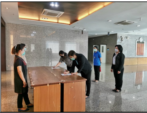
7. ลงทะเบียนด้วยปากกาของ ตนเอง