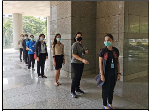
1. เข้าแถวรอเรียกเข้าตึก