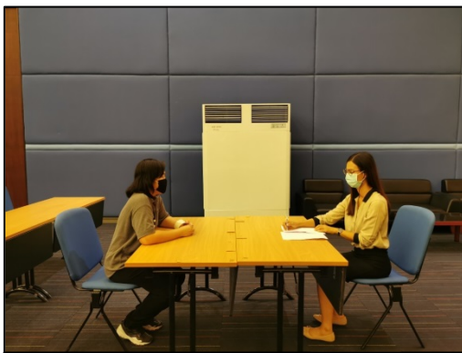
10. เลือกตำแหน่งที่จะเข้ารับการบรรยาย