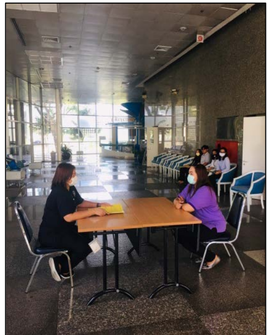
17. ส่งแฟ้มประวัติเพื่อตรวจสอบ ความถูกต้อง