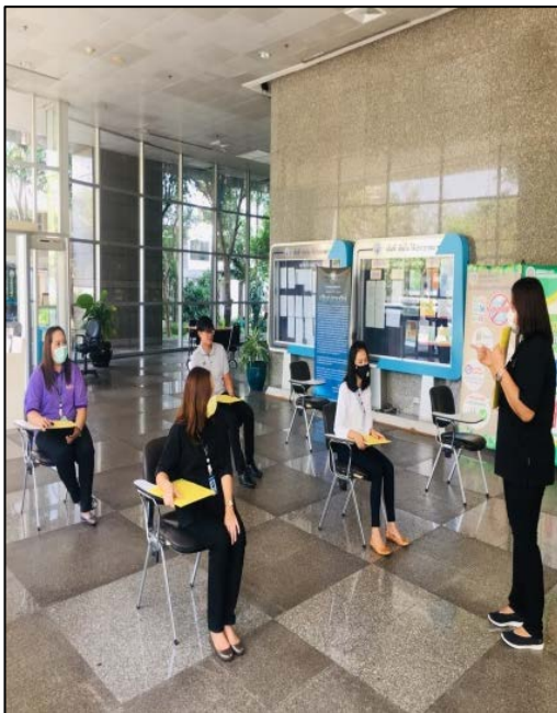
16. เจ้าหน้าที่อธิบายและเขียนประวัติ ด้วยปากกาตนเอง