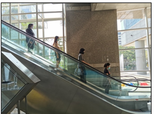
13. ทำทะเบียนประวัติที่ชั้น 1