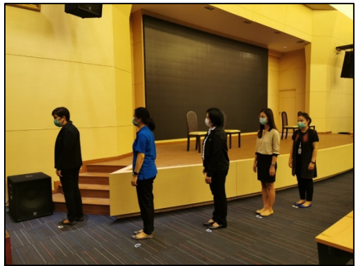
9. เข้าแถวรอเรียกตามจุด mark