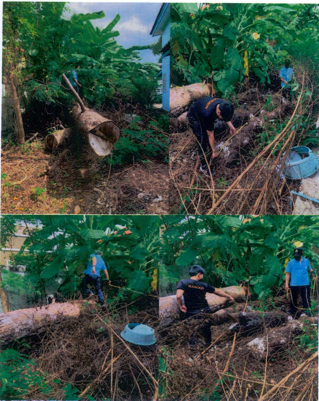
ภาพถ่ายต้นยางนา (จำนวน ๔ ท่อน)